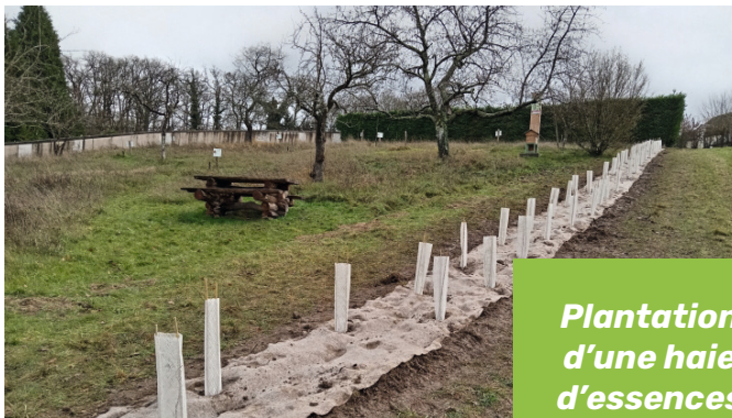
Plantation d'une haie d'essences variées et locales

Dans une ambiance détendue (avec quelques glissades plus ou moins involontaires sur le terrain en pente rendu boueux par les dernières pluies !) et très active pour les adultes, l'utile leçon sur les enjeux de biodiversité et la belle démonstration de l'action citoyenne resteront sans aucun doute dans les esprits. Il vous reste à découvrir le résultat à côté du cimetière, le long de la parcelle du verger pédagogique « le P'tit Verger ». Que tous les participants à cette opération soient chaleureusement remerciés.