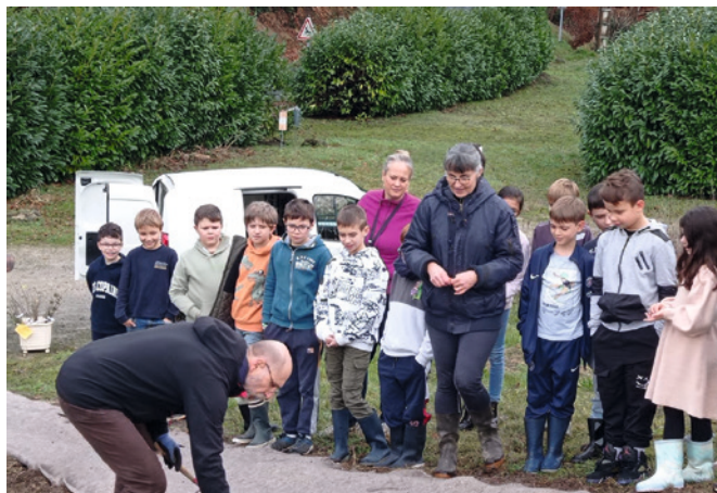
Les enfants attentifs aux explications

Dans une ambiance détendue (avec quelques glissades plus ou moins involontaires sur le terrain en pente rendu boueux par les dernières pluies !) et très active pour les adultes, l'utile leçon sur les enjeux de biodiversité et la belle démonstration de l'action citoyenne resteront sans aucun doute dans les esprits. Il vous reste à découvrir le résultat à côté du cimetière, le long de la parcelle du verger pédagogique « le P'tit Verger ». Que tous les participants à cette opération soient chaleureusement remerciés.