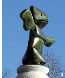
3. Fontaine par Max Ernst à Amboise