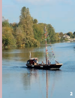
2. Le Jean-Bricau II